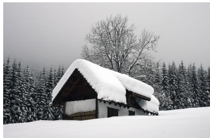
Una baita in Val Bartolo